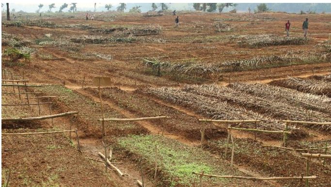
Vue partielle des plantations maraîchères fournies par la FAO à Tshikapa dans la province du Kasai.