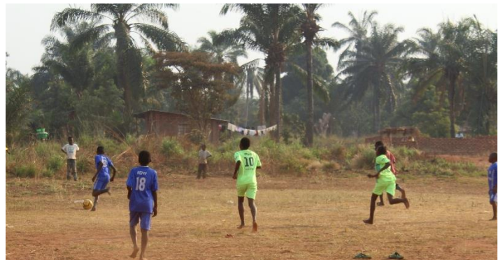
Les enfants non accompagnés jouant au football avec les enfants autochtones dans le cadre des activités récréatives à Tshikapa.